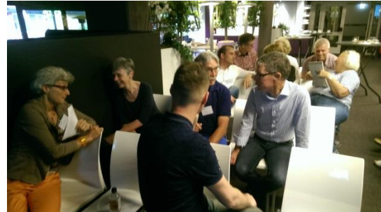
Speedmeet tijdens eerdere bijeenkomst

We zagen in mei drie interessante presentaties: Ten eerste Stichting Urgente Noden (SUN Nederland), de Woonbond (Energie) en de eerste informatie over de Voorzieningenwijzer .